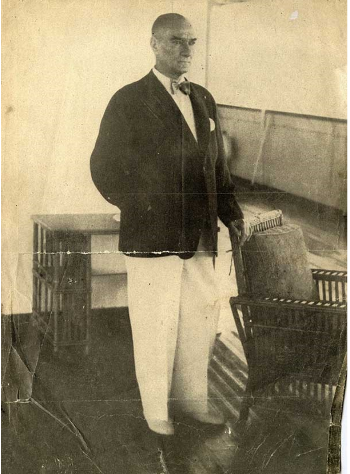
16 Kasım 1938 tarihinde Mustafa Kemal Atatürk'ün tabutu, Türk bayrağı ile örtülmüş bir katafalk üzerine konuldu ve Dolmabahçe Sarayı'ndaki büyük tören salonuna